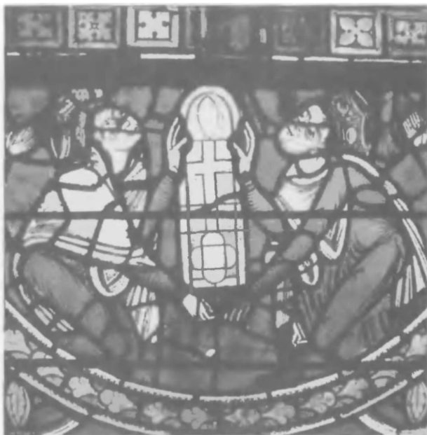
Генрих II Плантагенет и Альенора Аквитанская. Витраж собора в Пуатье