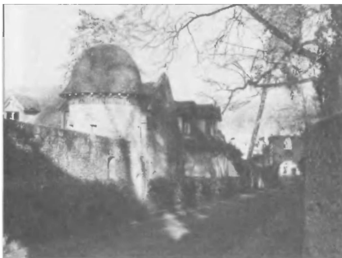
Сернейское цистерцианское аббатство