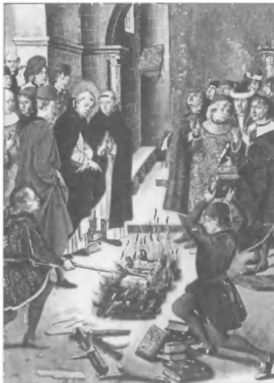
Диспут святого Доминика с Гильбером де Кастром в Фанжо