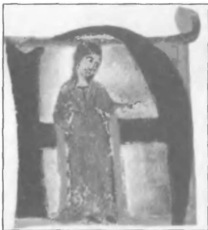
Графиня де Диа