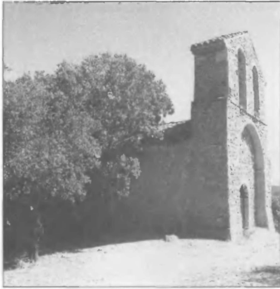
Муассак. Здесь инквизиторы сожгли двести десять человек в один день