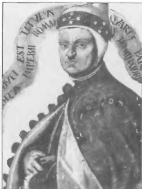
Папа римский Иннокентий III