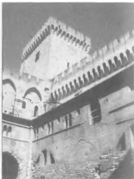
Авиньон. Сюда из Монсеюра в 1242 году отправилась карательная экспедиция, которая перебила бывших здесь проездом инквизиторов Тулузы