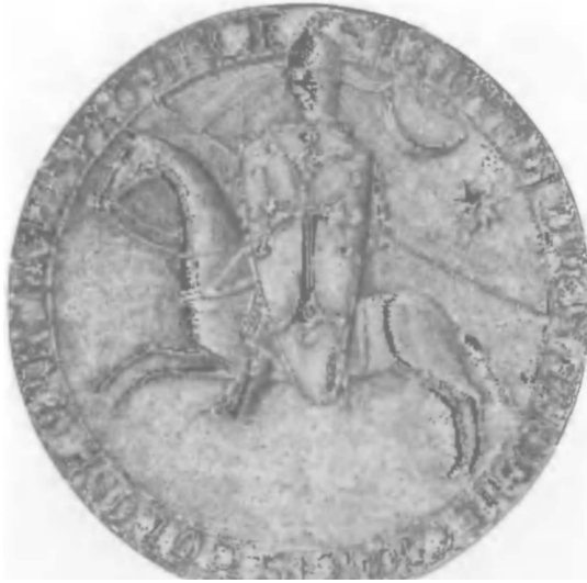
Раймон VI, граф Тулузский. Изображение на монете