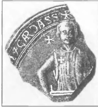
Симон де Монфор