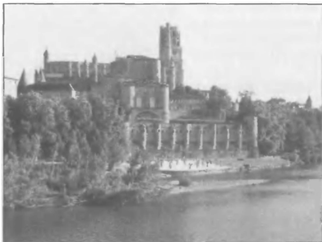
Альби. По названию этого города еретики Окситании получили название «альбигойцы»