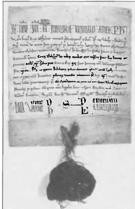
Оммаж, принесенный Симоном де Монфором французскому королю за южнофранцузские провинции