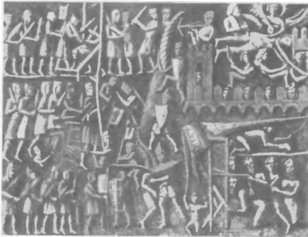
Осада Тулузы крестоносцами во время Альбигойских войн