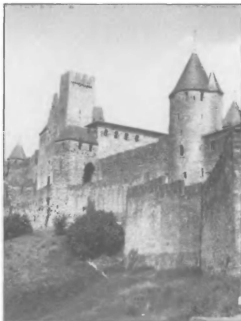
Каркассон — один из центров заговоров буржуа и консулов против инквизиции в конце XIII века