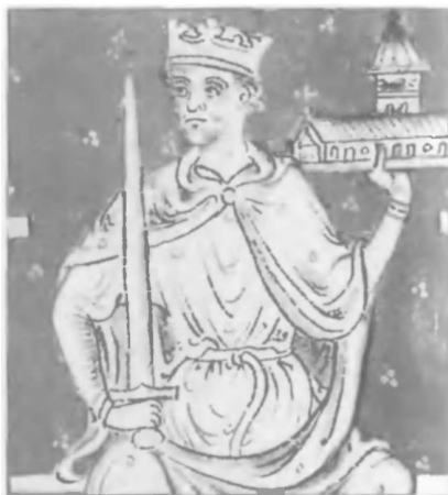
Ричард Львиное Сердце – король и трубадур