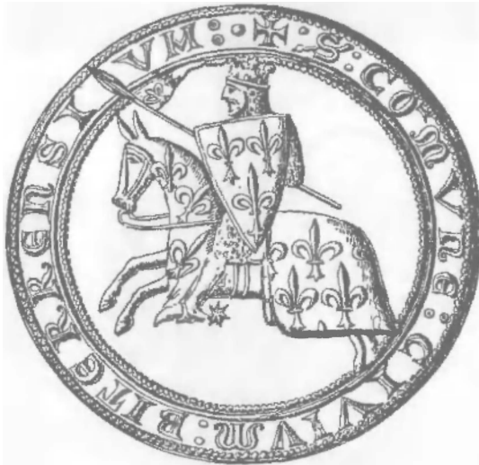
Раймон-Роже Транкавель. Изображение на монете из Безье