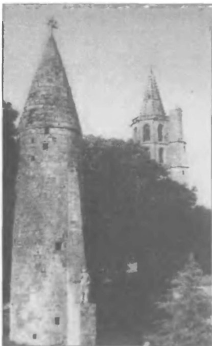
Авиньонет в Лорагэ. Здесь в 1242 году файдиты убили инквизиторов и сопровождавший их отряд