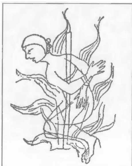
Катар на костре