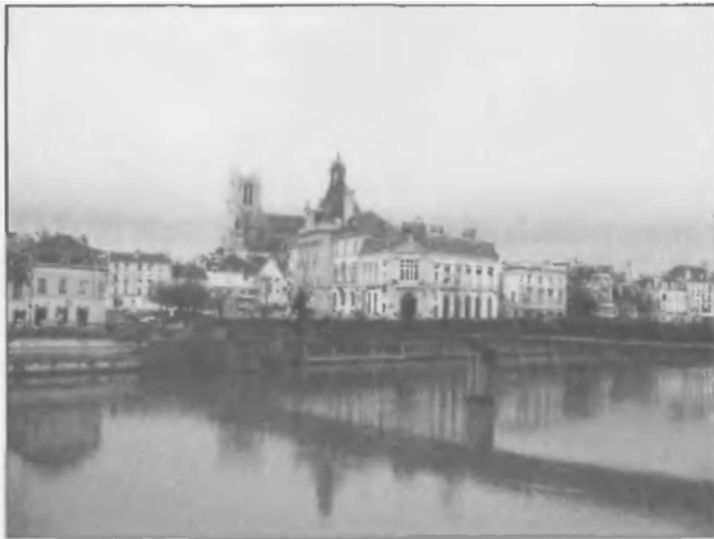
Мо. На ассамблее в этом городе были подготовлены предварительные условия мирного договора, который граф Раймон Тулузский подписал с Людовиком IX