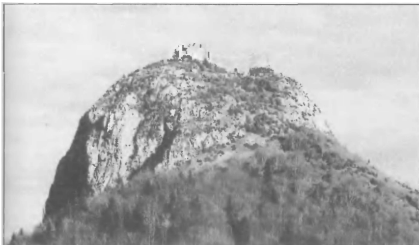
Монсегюр, последняя катарская крепость в Пиренеях, павшая 16 марта 1244 года