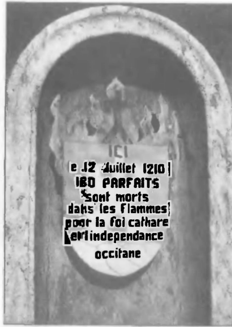
Минерв. Надпись гласит: «Здесь 12 июля 1210 года 180 совершенных умерли в пламени за катарскую ересь и окситанскую независимость»