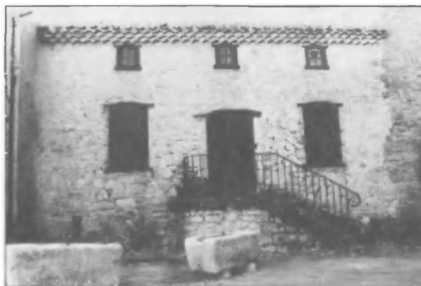
Дом святого Доминика в Фанжо