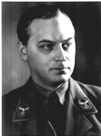
Meinem Hauptanliegen waren die Schriften mit engl. Text von A. Rosenberg München, den 19. 1. 1938

Уже говорилось, что у христианина - противника иудаизма есть только две альтернативы: деиудайзировать Христа или отвергнуть Его. Хьюстон Стюарт Чемберлен, следуя многим европейским богословам XIX столетия, попытался доказать, что Иисус был арийцем, жившим в изолированной области Галилеи, отделенной в расовом отношении от остальных народов региона. Автор Основ XIX столетия стремился показать, что изолированная нордическая группа была оторвана от основного тела нации и что Христос происходил от этих людей. Фельдмаршал Людендорф и другие просто отрицали Иисуса, и были антихристианами точно так же, как антисемитами. И те, и другие вместе принимали идею, что Библия, в равной мере Ветхий и Новый Завет, является подлинной историей.