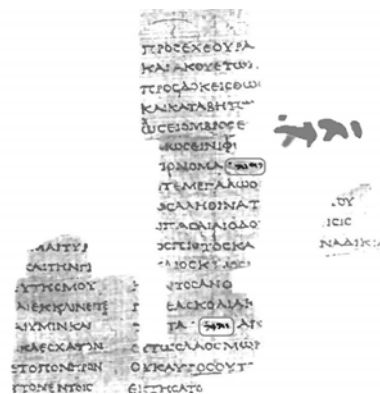
Papyrus Fouad 266 Второзаконие 31:28-32:7

Однако в более поздних списках он, вероятно, передавался греческим титулом КС (или, в полной форме, — КΥΡΙΟΣ). Но текст в эпоху Христа в обоих случаях (с יהוה и с КС) читался без произношения YHWH — либо Адонай , либо Кюриос . Помните традицию «Qere perretum»? Однако отсюда Общество Сторожевой башни делает вывод, что во всех греческих переводах Ветхого завета вплоть до II века н. э. значился именно Тетраграмматон, а не греческое слово κύριος.